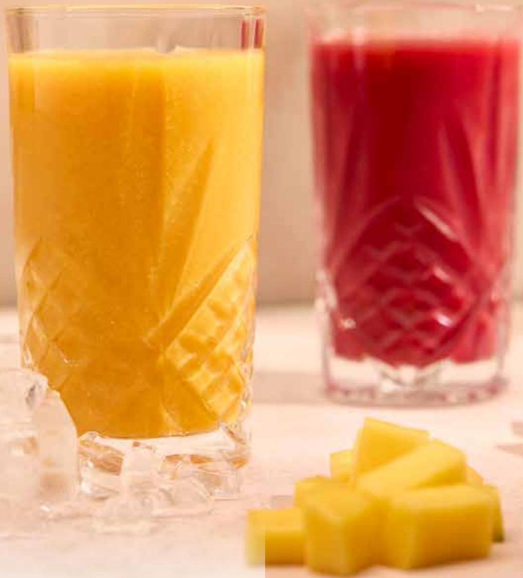
FROZEN SMOOTHIE 8.5 Aardbei & kers of Mango & passievrucht